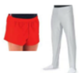
Short de gym ou sokol uni