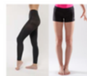
Collant ou short moulant