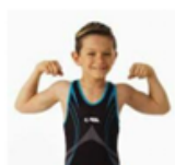
Leotard sans manche ou avec manches courtes