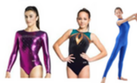
Justaucorps avec ou sans manches ou Unitard